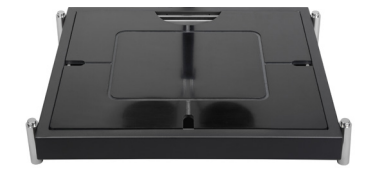
30.25" x 23.25" Smart W Countertop Carving Station Base and Drip Tray - Black 30.25 x 23.25 x 5 in 76.8 x 59.2 x 12.6 cm 1 unidad BCS000BKS18