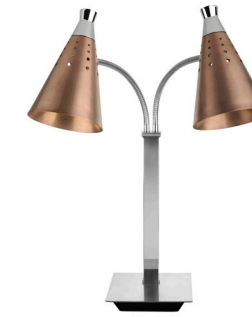
T-Collection Double Heat Lamp - Copper 18.75 x 13.5 x 30 in 47.5 x 34.4 x 76.1 cm 1 unidad BTC005COS18 110v