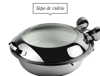
Tapa de vidrio

6.5 qt Round Smart W Chafer with Tempered Glass Lid and Food Pan 19.25 dia x 7.75 in | 49 dia x 19.5 cm 1 unidad BCH009MSS18