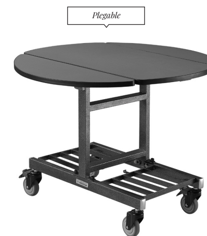
Foldable Room Service Trolley - Black 40.25 dia x 29.5 in | 102.3 dia x 75 cm 1 unidad BTR007BKS98

Las bandejas de goteo recogen los jugos y la grasa en exceso, mantienen el área limpia y facilitan el mantenimiento.