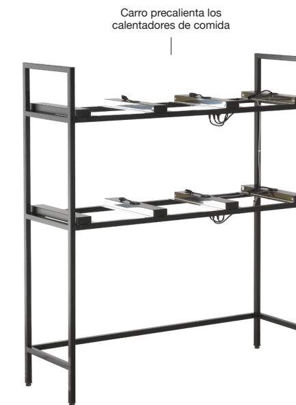
Hot Food Warmer and Trolley Caddy - Six Compartment 66 x 20.75 x 73.25 in | 167.5 x 52.5 x 186.2 cm 1 unidad BTC000BKS18

Puede aceptar: 15.25" x 14.5" Hot Food Warmer - 110v