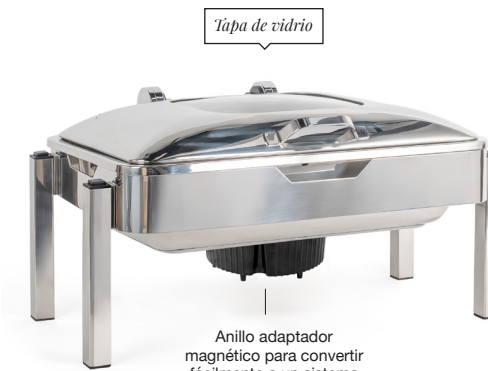
Tapa de vidrio

Anillo adaptador magnético para convertir fácilmente a un sistema de inducción