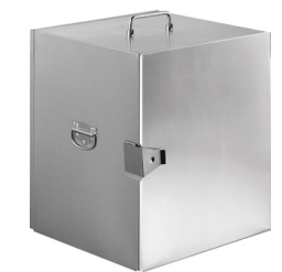
15.25" x 14.5" Hot Food Warmer - 110v 15.25 x 14.5 x 19.5 in | 39 x 37 x 49.5 cm 1 unidad BTC001BSS18

Puede aceptar: (6) 15.25" x 14.5" Hot Food Warmer - 110v